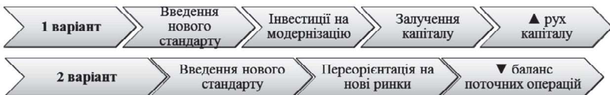
Рис. 2. Вплив запровадження нових стандартів на баланс поточних операцій та баланс руху капіталу країни-експортера

Кількісне послаблення сприяє знеціненню валюти країни двома шляхами: по-перше, воно впливає на очікування спекулянтів щодо можливості падіння вартості валюти; по-друге, значне збільшення пропозиції національної валюти призводить до зниження внутрішньої відсоткової ставки в порівнянні з відсотковими ставками країн, в яких кількісне послаблення не застосовується. У свою чергу, це спричинить зростання обсягів капіталу в девальвованій валюті, що переміщується до країн із вищими відсотковими ставками, для збільшення вигоди від інвестування і торгівлі, що призведе до подорожчання валюти цих країн. Таким чином, експорт країни-одержувача капіталу буде підірвано внаслідок зростання її валютного курсу, а зростання імпорту з країни, що здійснила кількісне послаблення, спричинить порушення торговельного балансу [14, с. 9]. Таким чином, програма кількісного пом'якшення є нетрадиційним засобом грошово-кредитної політики, що використовуються центральними банками для стимулювання зростання національної економіки, у випадках коли коректування грошово-кредитної політики за допомогою звичайних методів стало неефективним або неможливим.